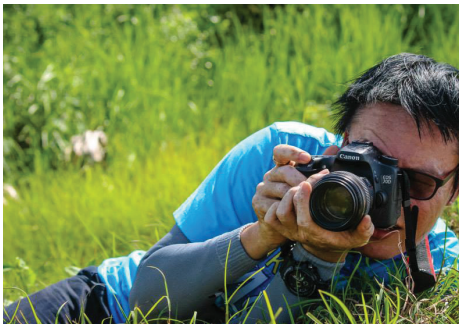
ซ้ายบน: ร่วมแรงร่วมใจปั่นเพื่อแม่ BikeForMom ซ้ายล่าง: เบื้องหลังของรูปภาพสวย ๆ กลาง: มุมสีสันวันงาน BikeForMom ขวา: อีก 11 กิโลเมตร ถึงวันฉัตร