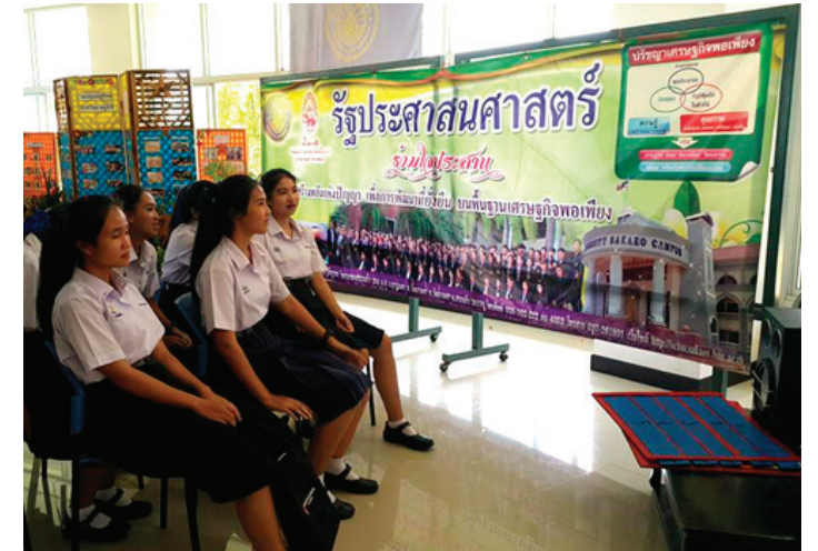
รัฐประศาสนศาสตร์ ร่วมใจประสาน

สถาบันอุดมศึกษาจึงไม่เพียงการผลิตคนสู่ตลาดแรงงานในโลกปัจจุบันและอนาคตเท่านั้น แต่ต้องผลิตพลเมืองโลกที่มีความรับผิดชอบต่อสังคมและมีจริยธรรม ดังนั้น สถาบันอุดมศึกษา ต้องมีบทบาทนำในการแสดงความรับผิดชอบต่อสังคม ตอบสนองความต้องการของสังคม ทำหน้าที่ “Think Tank” ให้แก่สังคมมีการสื่อสารกับสังคม ไม่ใช่เป็นหอคอยงาช้างหรือเป็นผู้เชี่ยวชาญรับใช้องค์กรอื่น จัดการเรียนการสอนให้นักศึกษาตระหนักในการมีส่วนร่วมรับผิดชอบต่อสังคม โดยสถาบันอุดมศึกษาต้องให้ความสำคัญกับประเด็นความ